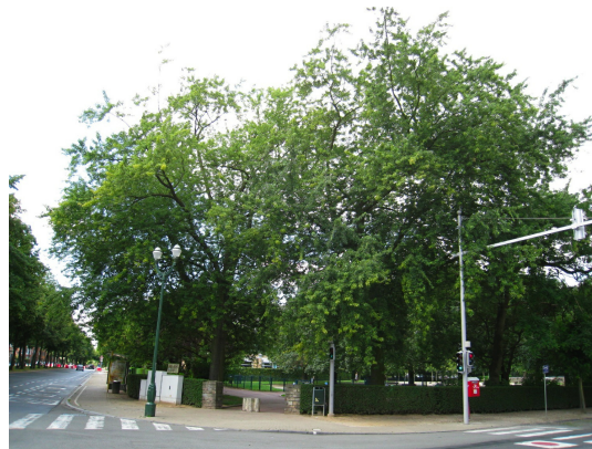
, 29 Juillet 2008